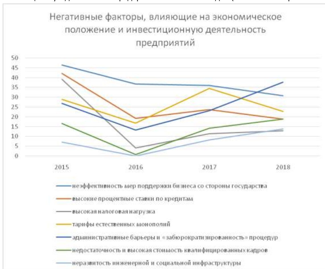
Рисунок 3. Динамика негативных факторов, влияющих на экономическое положение и инвестиционную деятельность предприятий в 2015-2018 годах. (в % от числа опрошенных)