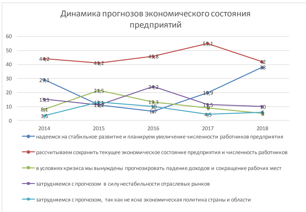
Рисунок 2. Динамика оценок экономических перспектив предприятий по годам (2014-2018 г.г.)

Графическое отражение указанных трендов на рисунке 2 демонстрирует показатели мониторинга прогнозов предприятий: