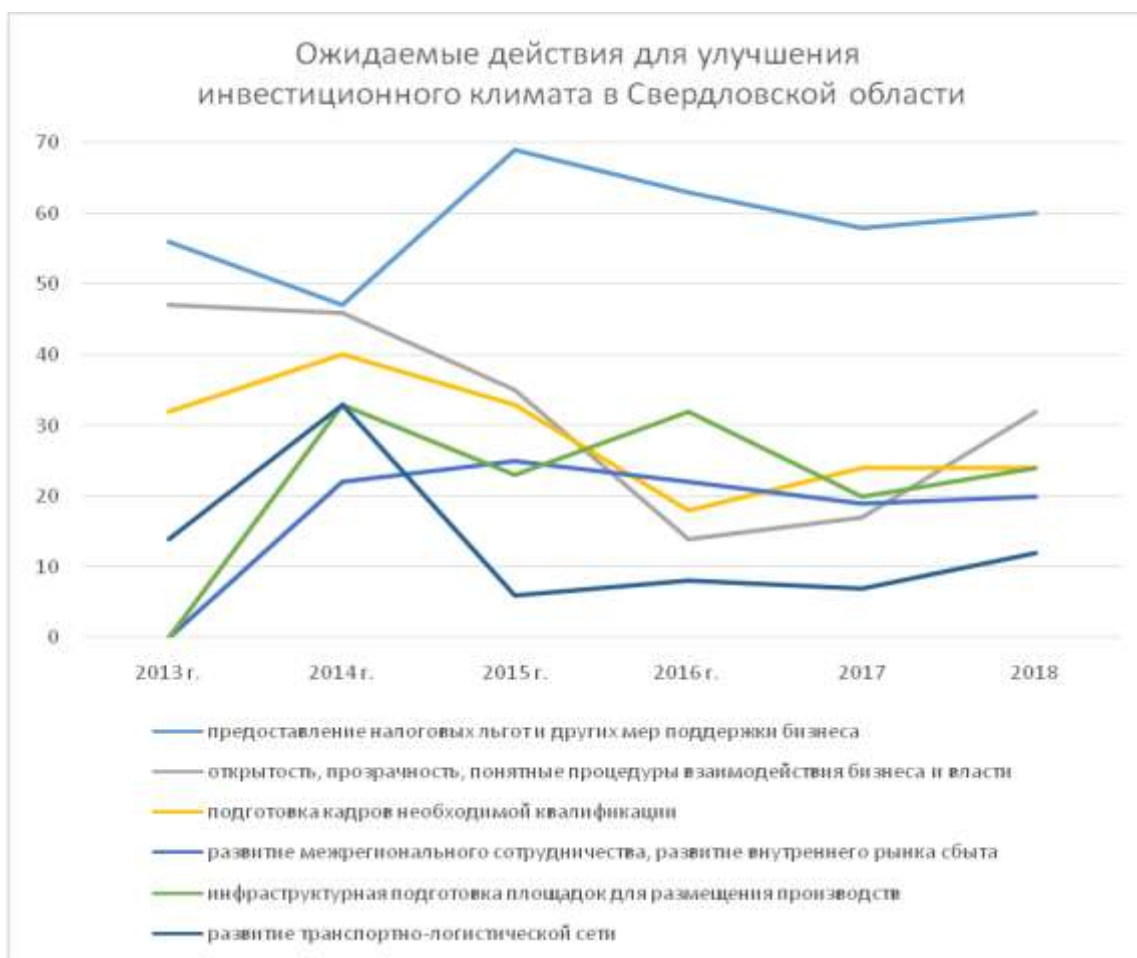
Рисунок 5. – Динамика мнений о необходимых действиях по улучшению инвестиционного климата (в % от числа опрошенных)

График динамики ожидаемых действий от Правительства Свердловской области наглядно демонстрирует взлет патерналистских настроений в пост-кризисный 2014 год с одновременным падением популярности мер поддержки реальной инвестиционной деятельности. С 2015 по 2018 годы наблюдается постепенное восстановление конструктивных ожиданий к взаимодействию бизнеса и власти.