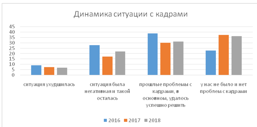
Рисунок 6. - Динамика оценок ситуации с кадрами на предприятиях по итогам 2015, 2017 и 2017 г.г.(в % от числа опрошенных)

Среди тех предприятий, кто отметил ухудшение или сохранение негативной ситуации по кадровому вопросу (таблица 16), 40% указал на