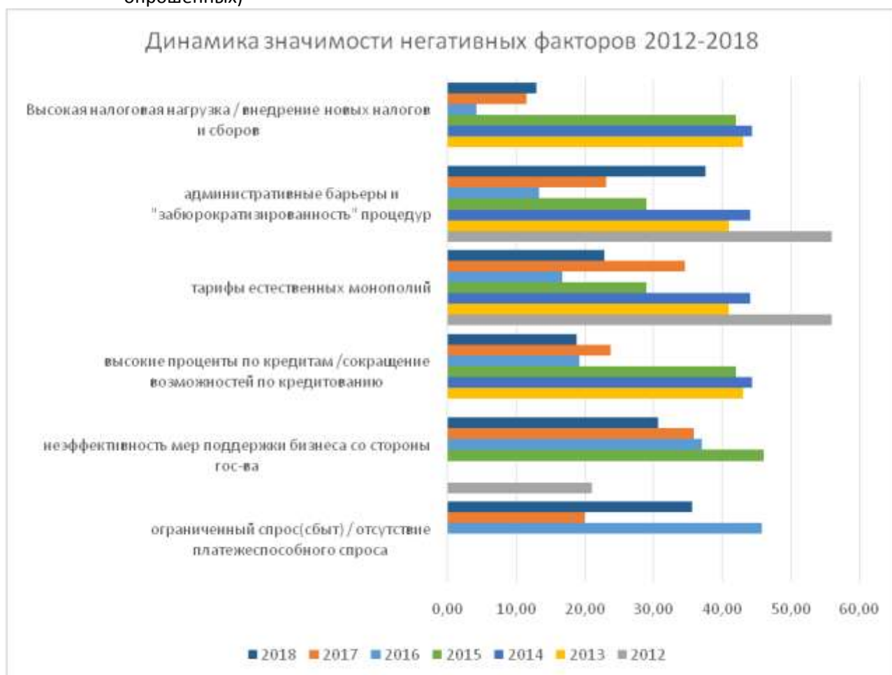
Рисунок 4. - Динамика негативных факторов, влияющих на экономическое положение и инвестиционную деятельность предприятий в 2012-2017 годах ( в % от числа опрошенных)